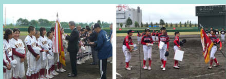
日専連旭川杯野球大会