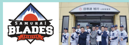
士別サムライブレイズ