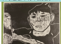
日専連旭川 青年会長賞

日専連旭川児童版画コンクールを1991年(平成3年)から日専連本部の全国事業の一部として旭川地区にて毎年実施しております。